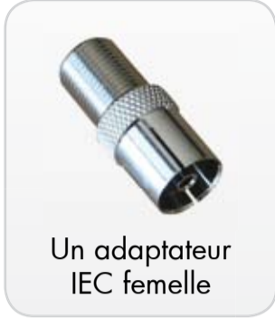
Un adaptateur IEC femelle