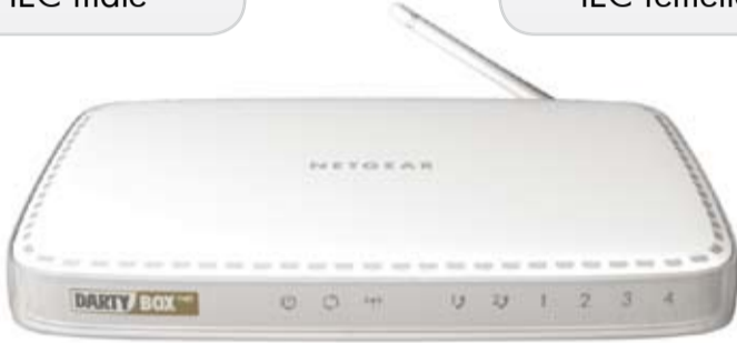
Une DartyBox THD