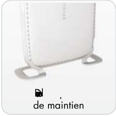
Un pied de maintien