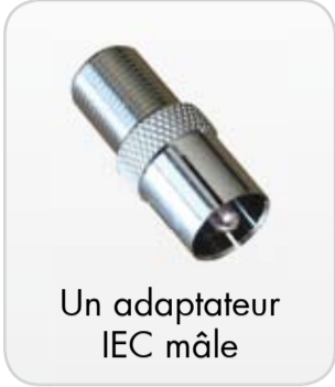
Un adaptateur IEC mâle