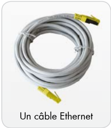
Un câble Ethernet