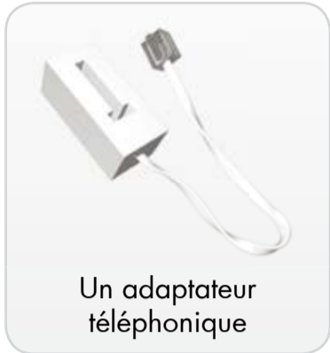
Un adaptateur téléphonique