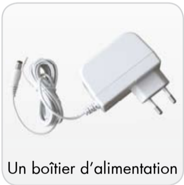
Un boîtier d'alimentation