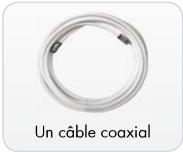
Un câble coaxial